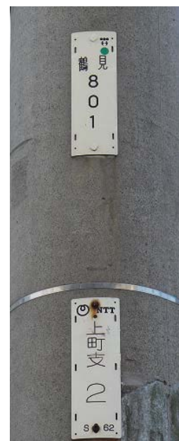
東京電力も使用しているNTT柱